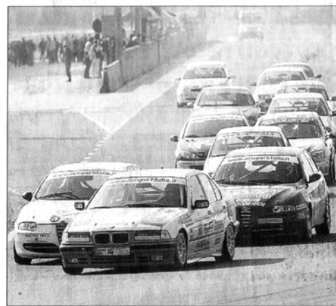
Il gruppo del CIVT alla partenza dell'ultima gara stagionale, a Misano